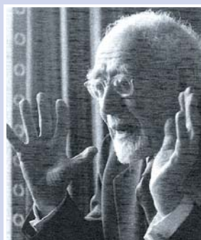
Leo Baeck (Londyn 1951)

LEO BAECK był człowiekiem znacznie wyprzedzającym swoją epokę. Dał temu wyraz jako rabin i jako uczonego popierając idee dialogu i tolerancji wobec innych wyznań i szkół myślenia. Już w latach pięćdziesiątych ubiegłego wieku nawoływał do religijnego dialogu Żydów z Chrześcijanami i Muzułmanami. Uważał, że tylko lepsze, wzajemne poznanie prowadzi do zrozumienia drugiej strony i współpracy opartej na poszanowaniu utrzymujących się odrębności.