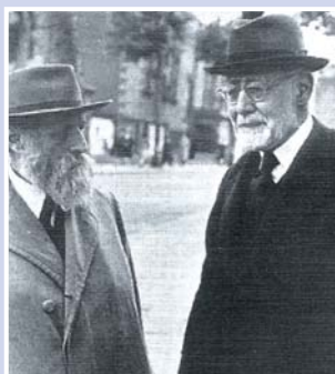
Leo Baeck i Martin Buber (Londyn 1947)